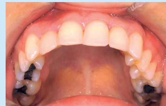
De orthodontie kan gestart worden direct na de verbreding.