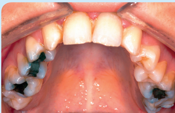
Situatie voor gehemelte verbreding.

Draai 1/4 toer tot het volgend kleurtje zichtbaar is. Doe dit 2x daags.