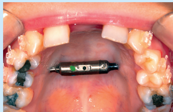
Situatie na verbreding met de smile distractor.