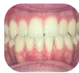
Vooraanzicht na behandeling