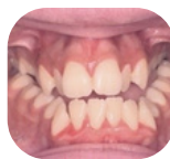
Vooraanzicht voor behandeling

Enmaal de gewenste verbreding bereikt is, zal de chirurg de TPD blokkeren, zodat deze niet meer smaller of breder kan worden. De TPD zal nog 4 tot 6 maanden blijven zitten.. Na deze periode, en wanneer de TPD niet langer nodig is voor orthodontische behandeling, zal de chirurg de TPD verwijderen.